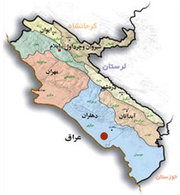
موقعیت روستا در استان