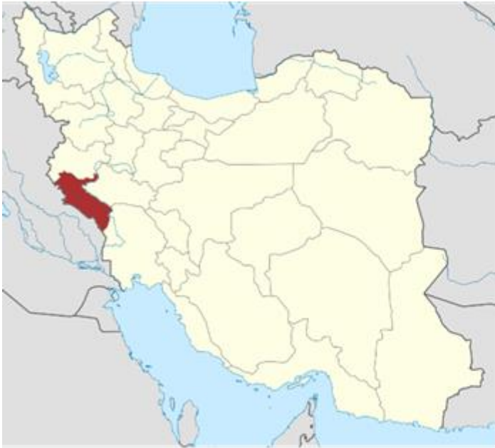
موقعیت استان در کشور