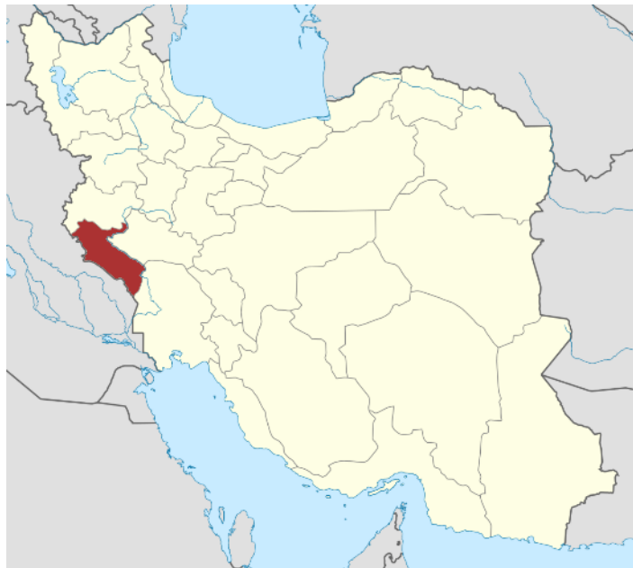
موقعیت استان در کشور