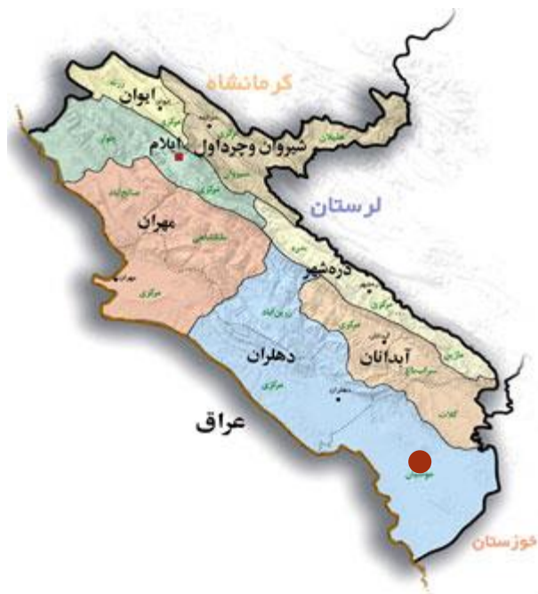
موقعیت شهر در استان