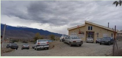
ياران البرز، عاشقلو، آذربايجان شرقي