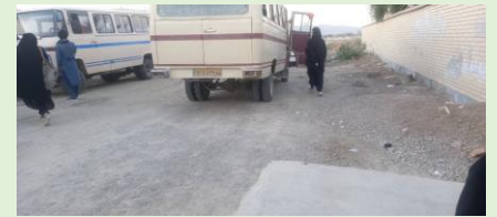
سيما سعادت، پيرسهراب، سيستان و بلوچستان