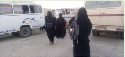
مریم میرزاخانی، ایتک، سیستان و بلوچستان