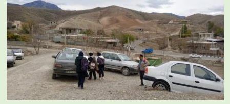
ياران البرز، عاشقلو، آذربايجان شرقي