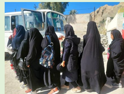
یاران البرز، پیردان، سیستان و بلوچستان