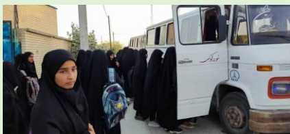
حامی، پيرسهراب، سيستان و بلوچستان