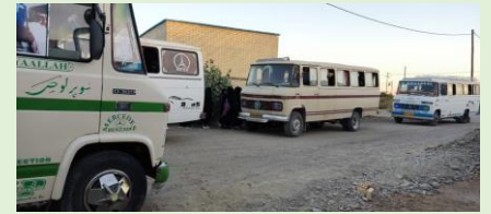
حامی، پيرسهراب، سيستان و بلوچستان