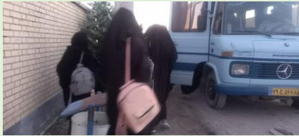
مریم میرزاخانی، ایتک، سیستان و بلوچستان