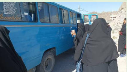
مریم میرزاخانی، ایتک، سیستان و بلوچستان