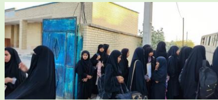
حامی، پيرسهراب، سيستان و بلوچستان