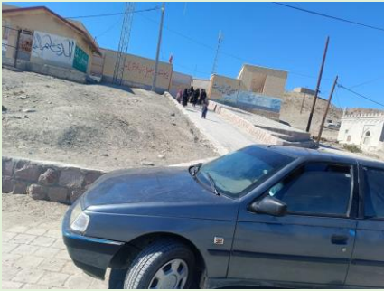
توسعه، پشامک، سیستان و بلوچستان