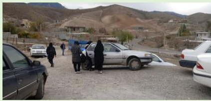
ياران البرز، عاشقلو، آذربايجان شرقي