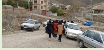
ياران البرز، عاشقلو، آذربايجان شرقي