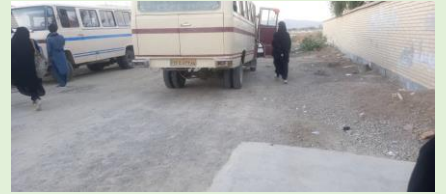
مریم میرزاخانی، ایتک، سیستان و بلوچستان