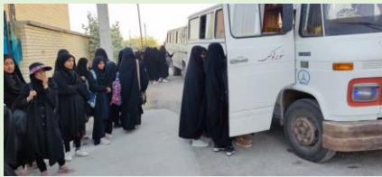
حامی، پيرسهراب، سيستان و بلوچستان