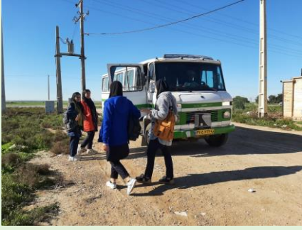
زهره جاوید کرمانی، دهلران، ایلام