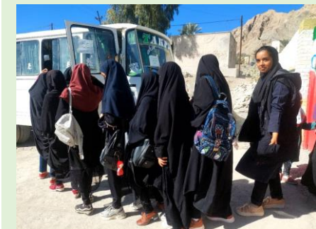
یاران البرز، پیردان، سیستان و بلوچستان