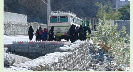
مریم میرزاخانی، ایتک، سیستان و بلوچستان