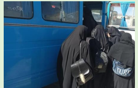
مریم میرزاخانی، ایتک، سیستان و بلوچستان