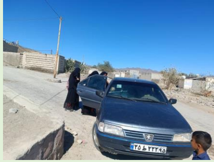
توسعه، پشامک، سیستان و بلوچستان